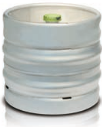
Fusto da 30 l

Birra lager di colore chiaro e dai riflessi dorati. Il particolare processo di fermentazione le conferisce un gusto pieno e armonioso. Il riadattamento in chiave moderna dell'antica ricetta la rende adatta ad un consumo a tutto pasto e ideale a soddisfare il desiderio di una birra equilibrata e dissetante.